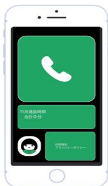
機能1. GPS位置情報を取得